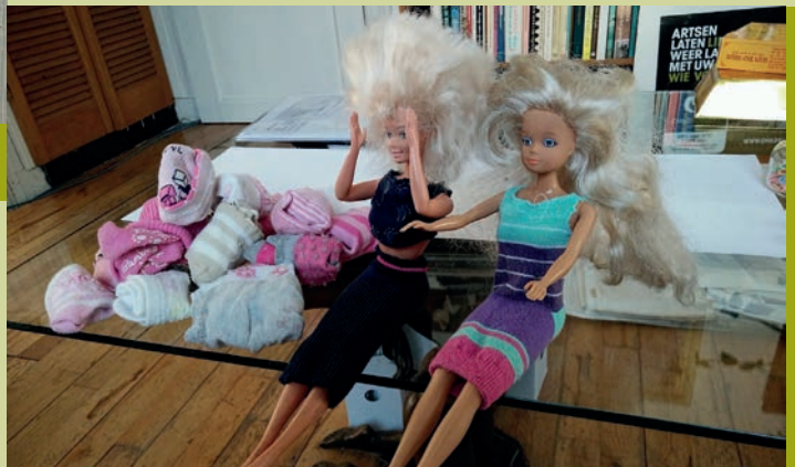
Hippe mode uit kindersokken.