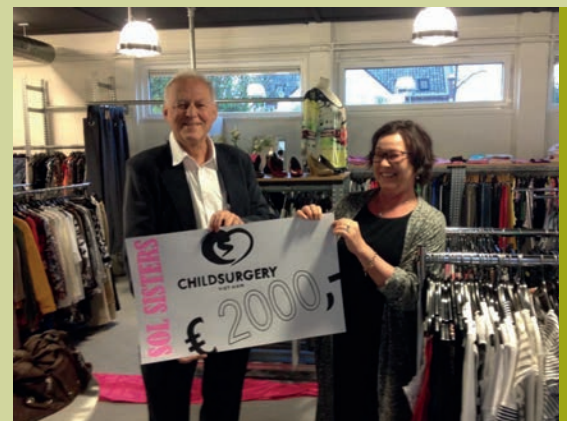
Overhandiging van de cheque door één van de "SOL sisters".

Een van onze trouwe begunstigers is de Stichting Ontwikkelingswerk Lichtenvoorde, de SOL Sisters. Uit kledingverkoop worden een aantal in het buitenland werkende organisaties financieel gesteund. Ook dit jaar mochten we weer een donatie in ontvangst nemen. Leuk om dat weer in te vullen bij een bakje en een praatje over ons werk. Zo blijft het aan beide kanten leven.