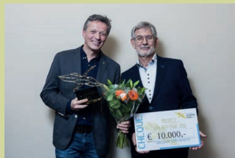
De cheque voor Passion for People