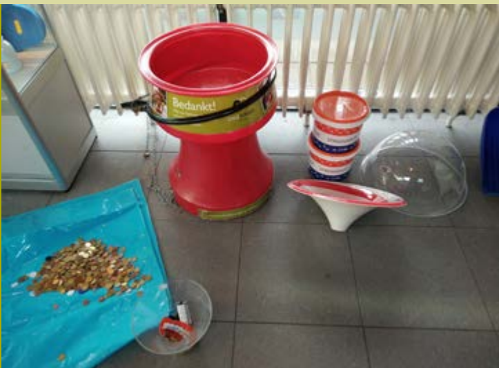
Vele kleintjes maken één grote.

vreemde vakantiegangers. Maar ook weer vreemd geld vanuit de VS, de UK, Polen, India, Zweden. Expats en toeristen? En wat verder nog rollen kan zoals: winkelwagenmuntjes van AH, Jumbo, Kras, Gamma. Drie platte ronde snoepjes, een paar knoopbatterijen, een knoop, een consumptiemunt van Beeld en Geluid. En we kregen twee zegeltjes en een Simkaart cadeau. Nou, dank je wel. Maar nou dat geld zelf? Het woog ca 5 kgr bij elkaar. 200 Euro! Ruim elfhonderd muntjes in drie maanden tijd. Gemiddeld twaalf per dag. Kindervreugde. Die krijgen een belevingsmoment terug. "Mamma! Nog één".