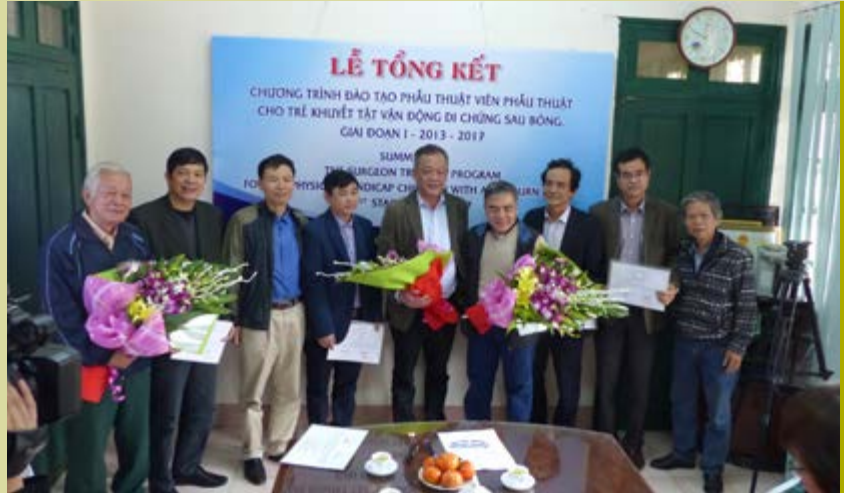
3 trainers, 1 organisator, 5 deelnemers