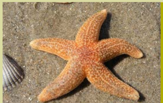
Laat kinderen niet verloren gaan

Het verhaal gaat in het kort als volgt: De oude man loopt over het strand en ziet een jongetje zeesterren oppakken en teruggooien in de zee. Hij zegt tegen hem: "dit heeft geen zin, het zijn er zoveel, je kunt ze toch niet allemaal redden". Het jongetje antwoordt: "maar deze wel".